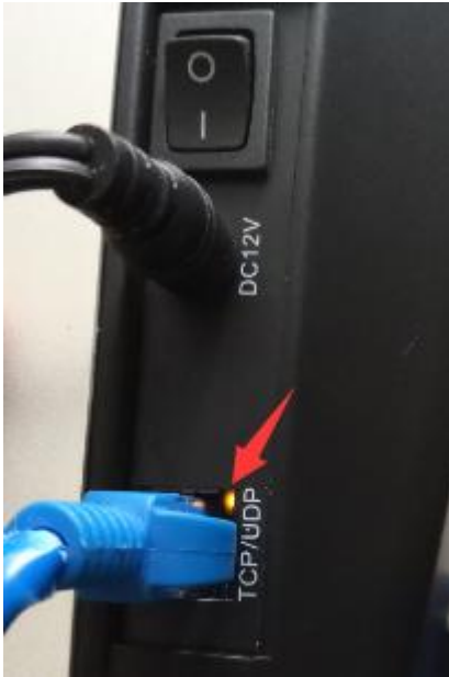
黄色灯常亮绿灯闪烁表示网线连接正常