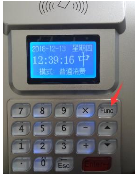
按 Func 键可进行功能设置

2. 按 Func 按钮找到“功能一”（右下角 Enter 键为确认键）里面第 7 项“IP 地址及端口设定”